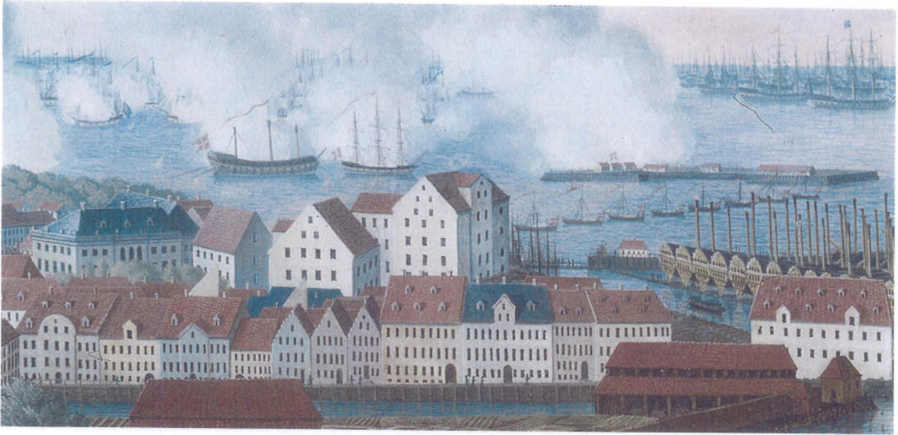
København under bombardement: I 1700-tallet var København en international shippingmetropol, men i 1807 bragte Napoleonskrigene de gode tider til ophør.